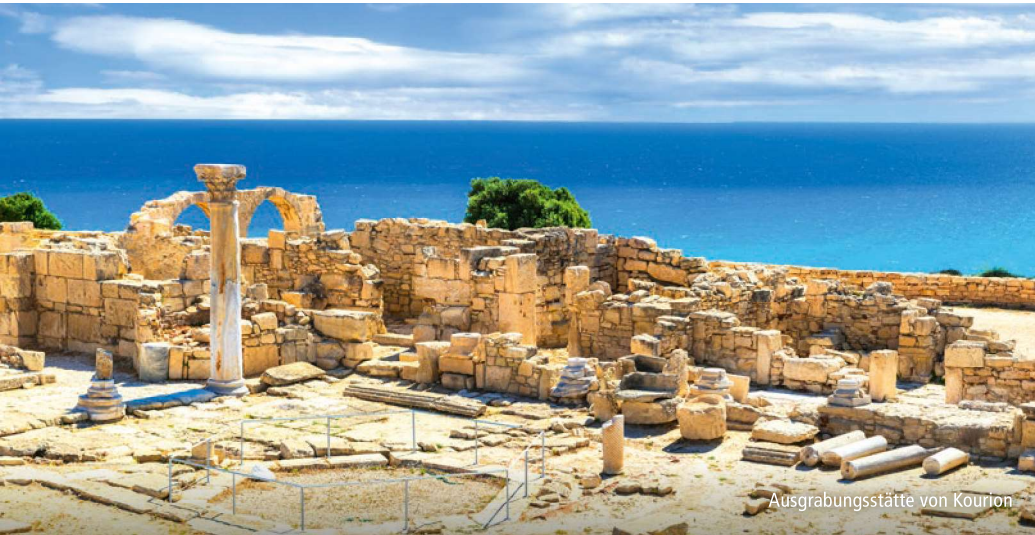
Ausgrabungsstätte von Kourion

Glanzlichter: ✨ Kyko-Kloster ✨ zweigeteilte Hauptstadt Nikosia ✨ Lala-Mustafa-Pascha-Moschee