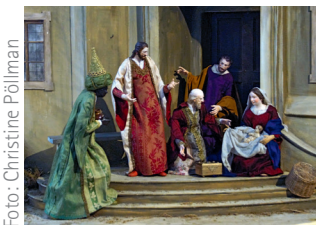
Krippe im Weihnachtsfestkreis