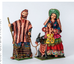
Flucht nach Ägypten, Kunstsammlungen des Bistums Regensburg