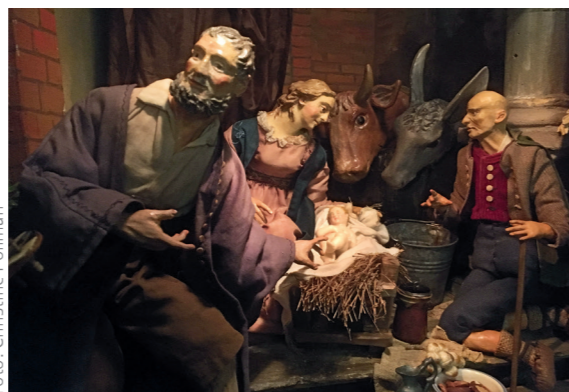
Jahreskrippe der Karmelitenkirche