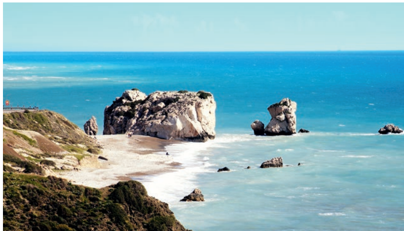
Kleines Bild: aphrodite-felsen

Lefkosias. Wir sehen die ehemalige Karawanserei Büyük Han und die zur Selimiye Moschee umgebaute Kathedrale von Ayia Sofia , bevor wir nach Limassol zurückkehren.