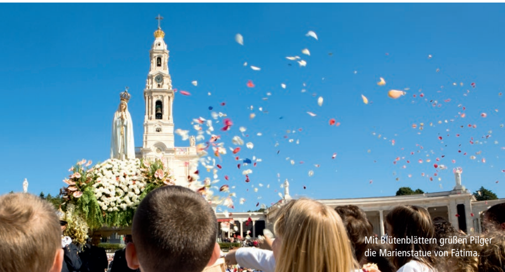
Mit Blütenblättern grüßen Pilger die Marienstatue von Fátima.

1. Tag: Anreise. Wir fliegen nach Lissabon und fahren mit dem Bus weiter in den Wallfahrtsort Fátima, der zu den bedeutendsten der katholischen Kirche zählt. Unser Weg führt zum Herzstück des Heiligtums – an der Erscheinungskapelle nehmen wir gemeinsam mit Pilgern aus aller Welt an der ersten stimmungsvollen Lichterprozession teil.