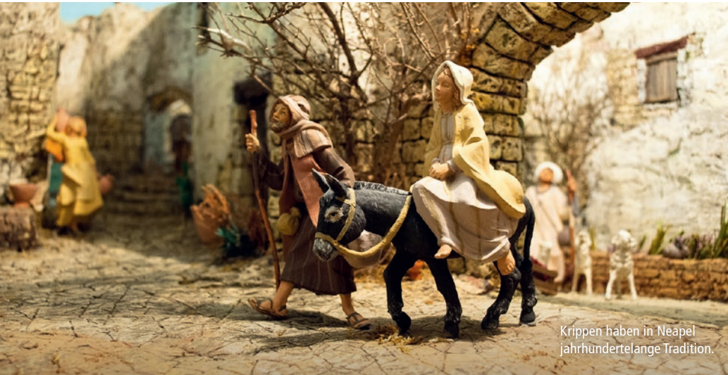
Krippen haben in Neapel jahrhundertelange Tradition.

Glaube, Kunst und Kultur in Süditalien: Funkelnde Kirchenkuppeln, originelle Weihnachtskrippen und gelebte Volksfrömmigkeit prägen die Adventszeit in Süditalien und geben unserer Reise eine besondere Faszination! Glanzlichter: ✨ Krippenstraße Via S. Gregorio Armeno in Neapel ✨ Pompeji ✨ Krippenausstellung in der Via della Conciliazione, Rom