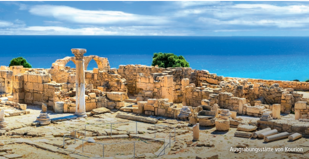
Ausgrabungsstätte von Kourion

Glanzlichter: ✨ Kykko-Kloster ✨ zweigeteilte Hauptstadt Nikosia ✨ Lala-Mustafa-Pascha-Moschee